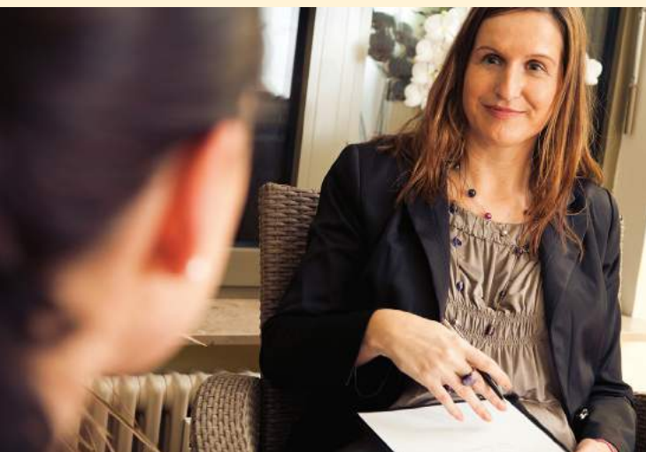
fit2work - Beratung, Kompetenz, neue Chancen

„Ich bin Personalentwicklerin in einem mittelgroßen Krankenhaus. Dank der fit2work-Beratung konnten wir eine diplomierte Krankenpflegerin, die seit über 20 Jahren im Haus arbeitet und an einer komplizierten Krebserkrankung leidet, im Unternehmen halten. Zudem hat sie über fit2work Förderungen und unterstützende Beratung bekommen.“